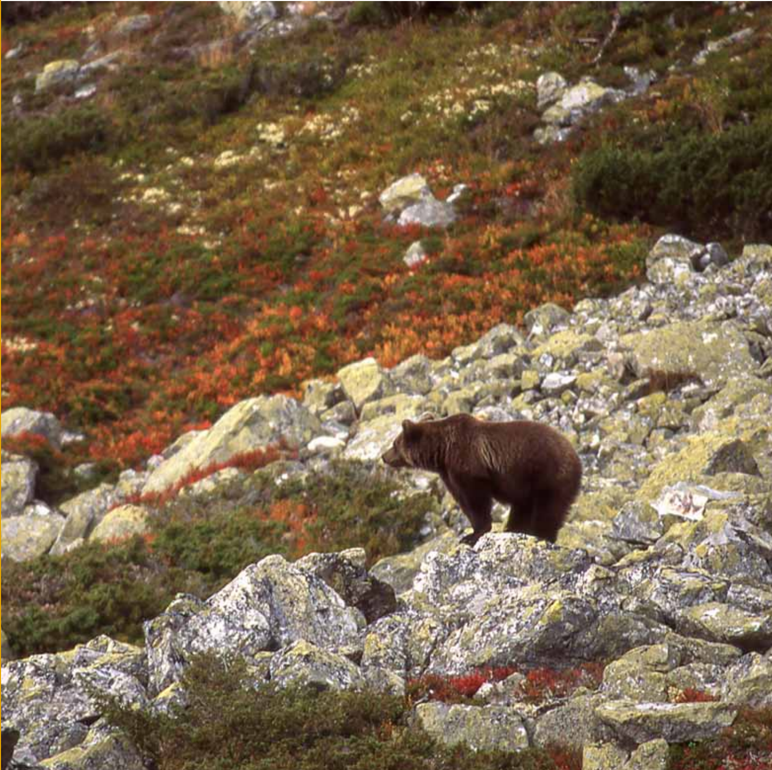
Björn i Sonfjällets nationalpark.